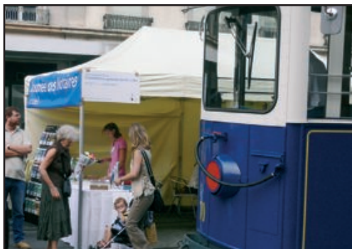
Grand succès en 2005.

O n ne pourra plus dire qu'ils demeurent cantonnés dans leurs études! Samedi 2 septembre prochain, les notaires romands ont décidé, comme ils le font désormais depuis 2003, de descendre dans la rue et d'aller résolument à la rencontre de la population. Réputés froids et distants - de même temps d'ailleurs que hautains, poussiéreux et incompréhensibles! - ils ont choisi de faire cette fois dans la simplicité et le pittoresque. Presque dans le populaire! Leurs bottes secrètes pour capter l'attention et harponner le chaland: un vieux tram d'autrefois et une brave tente de toile!